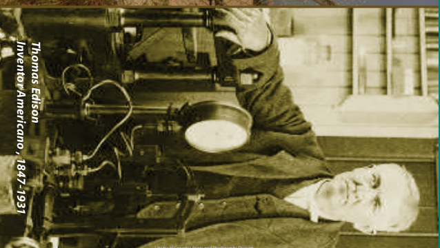
Thomas Edison Inventor Americano, 1847-1931